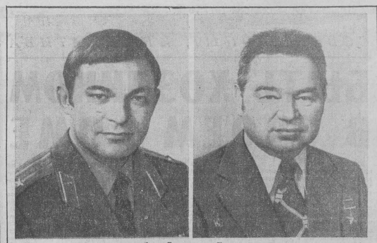
Командир космического корабля «Союз-26» Юрий Викторович Романенко.