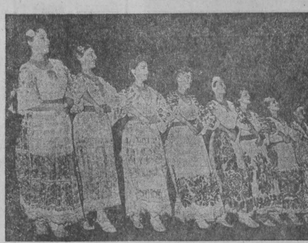
Большой популярностью у себя на родине и за рубежом пользуются выступлениями социально-танцевального ансамбля «Калос». В его репертуаре десятки песен и плясок, представляющих богатую палитру творчества Народов Югославии.