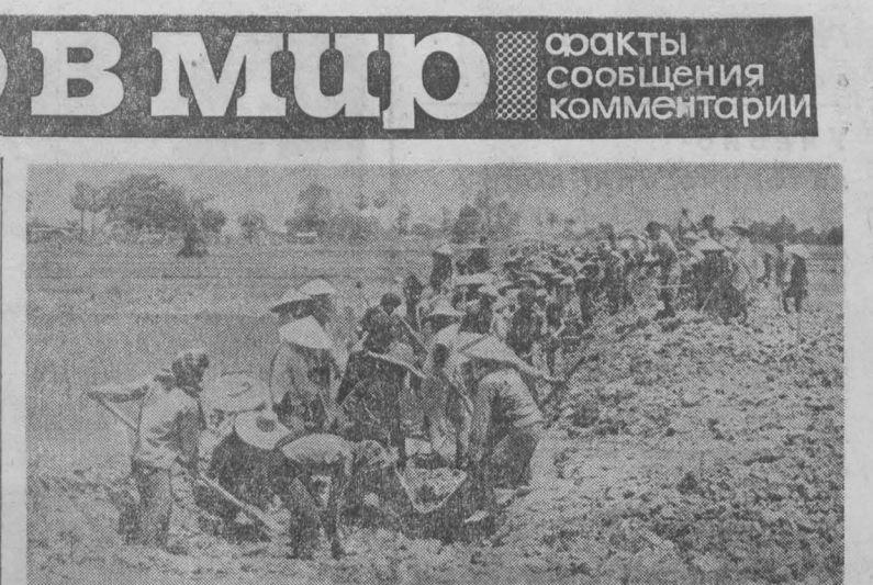
Во всех провинциях Лаосской Народно-Демократической Республики развернулось массовое движение за увеличение производства сельскохозяйственной продукции...