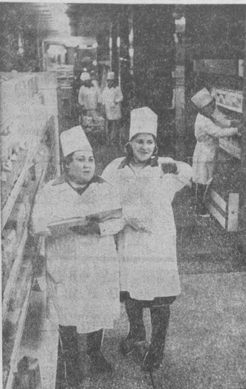
В центре Кемерово расположен крупнейший в городе производственный магистраль «Универсам-1». Ежедневно он обслуживает тысячи покупателей. Коллектив магазина известен высокой культурой обслуживания. Немалая заслуга в этом группе народных контролеров «Универсам-1».

Процентом от годового объема капитальных работ. Настала пора значительно ограничить выделение средств на новые стройки, сконцентрировав ресурсы на незавершенных объектах. Ныне на предприятиях различных отраслей в области развернуто 4327 строительных объектов. Из них 2551 — переходной с большим стажем и 1437 строки вновь начатых в текущем году.