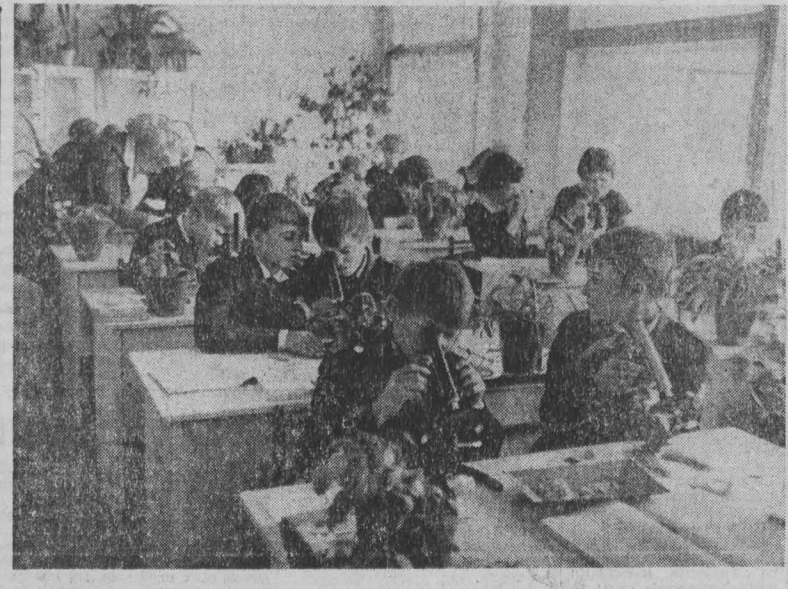
В КИРОВСКОМ РАЙОНЕ областного центра построено новое здание школы № 74 — самой крупной в районе.

Такие эпизоды — не редкость на дорогах Костромской и Ярославской областей. Лоси, головы которых в этих лесах неуклонно растут, привыкли доверять людям.