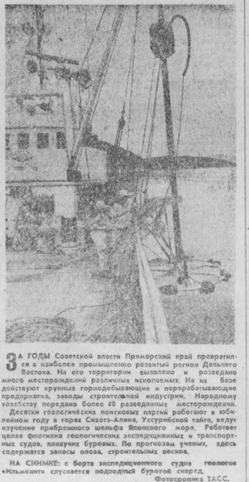
НА СНИМКЕ: с борта экспедиционного судна геологов «Ильмень» спускается подводный буровой снаряд.

МОСКВА. На ВДНХ СССР появился новый экспонат — кормоборочный комбайн «КС-100», опытный прототип которого вынул Гомельский завод сельскохозяйственного машиностроения. Новичок уже получил международное признание: на осенней сельскохозяйственной выставке «Земля — кормилица-77» в Чехословакии он был удостоен медали «Золотой колос» и диплома.