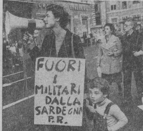
ИТАЛИЯ. Ликвидация американских военных баз на острове Сардиния потребовала участия демонстрации, состоявшейся в Риме. НА СНИМКЕ: плакат гласит: «Военные, вон с Сардинии».