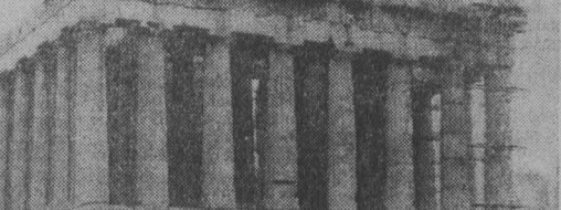
ГРЕЦИЯ. Генеральный директор ЮНЕСКО Амаду-Матар Мбу выступил с призывом сохранить и окопательно разрушения исторические памятники Акрополя, созданные 25 веков назад.