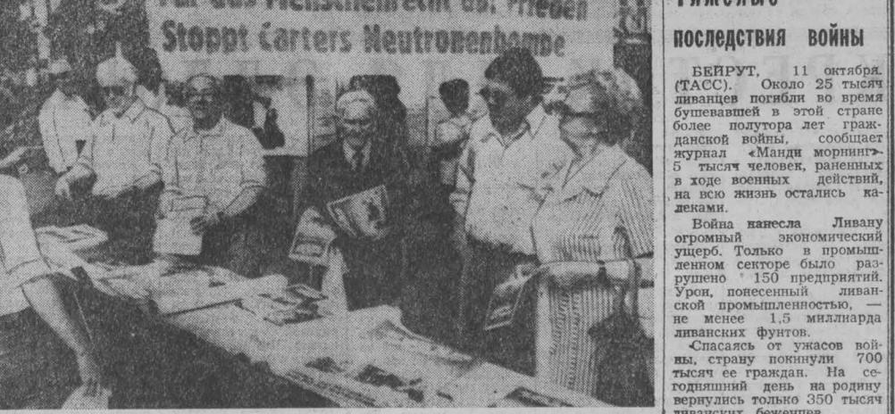
Лицо «свободного мира»

НА СНИМКЕ: сбор подписей в Эссене под протестом против планов производства нейтронной бомбы в США.