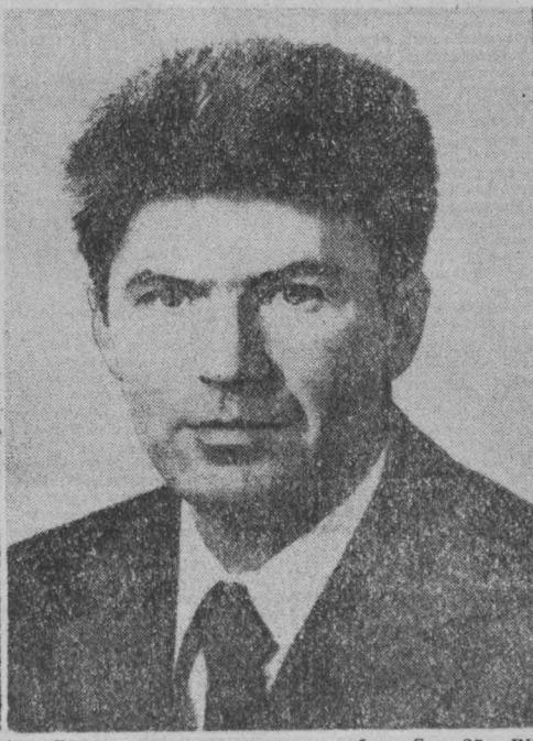
Бортинженер космического корабля «Союз-25» РЮМИН Валерий Викторович. (Принято по фототелеграфу).