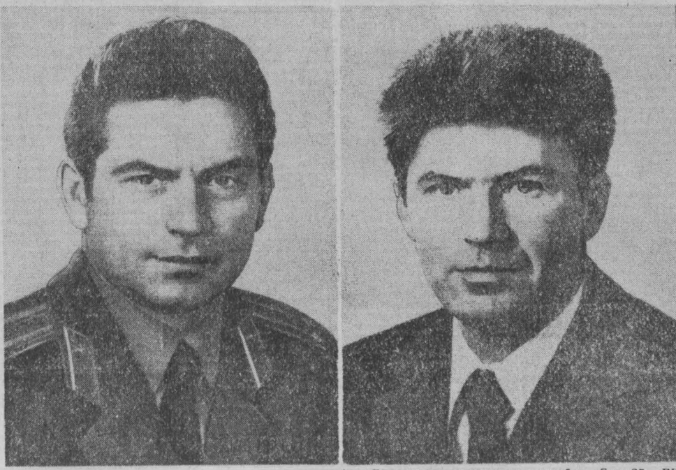
Командир космического корабля «Союз-25» КОВАЛЕНКО Владимир Васильевич.

С 14 до 23 часов корабль «Союз-25» будет находиться вне зоны радиовидимости с территории Советского Союза. В это время космонавты будут отдыхать.