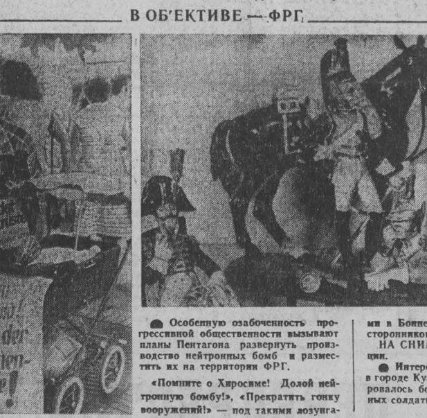
В ОБЪЕКТИВЕ — ФРГ.