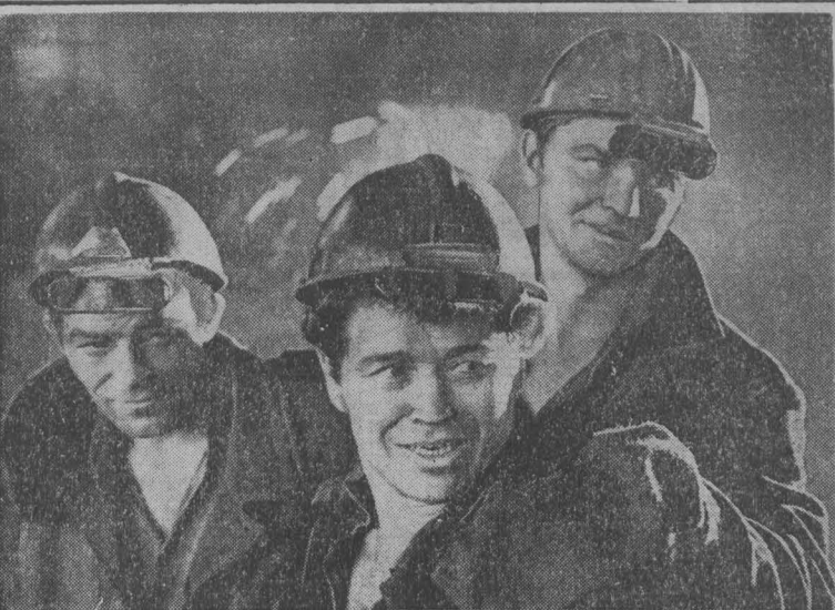
Высоких показателей в труде добиваются сегодня металлурги электросталеплавильного цеха Кузнецкого металлургического комбината им. В. И. Ленина. Включившись в социалистическое соревнование за экономию металла и электроэнергии, коллектив цеха достойно несет трудовую вахту.

Массовая демонстрация и митинг, посвященные 34-й годовщине начала в Италии освободительной войны про-