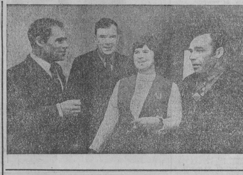
ИЗДАНО В КЕМЕРОВЕ