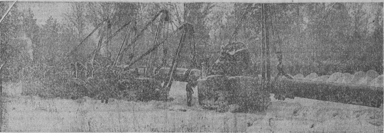
Железным пунктиром по всей трассе расставлены теплоизоляционные колонны.