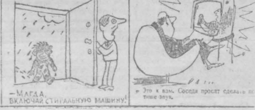
— МАГА, ВКЛЮЧАЯ СТАЦИОНАРНУЮ МАШИНУ. — Это и есть, Собака просит сделать и такие звуки.