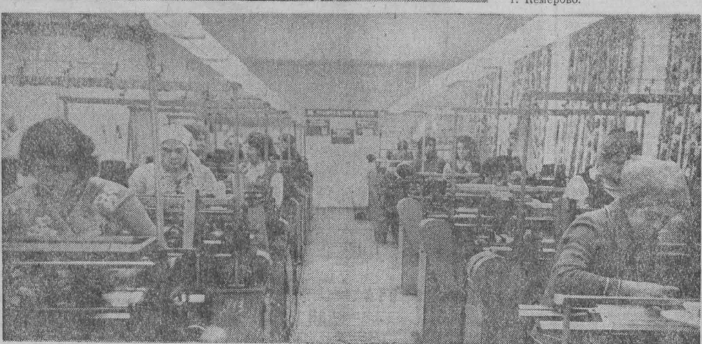
г. Кемерово.

НА СНИМКАХ: одна из лучших работниц ателье — Г. Д. Комарова; цех вязальных машин.