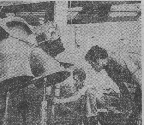
НА СНИМКЕ: в цехе лейтинского завода «Пупиш-Уд-гебзаверг» уже изготовлены компрессоры для нефтехимической и цементной промышленности Советского Союза.