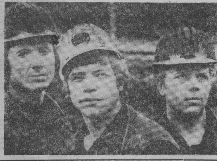
На главной проходной завода бросается в глаза довольно длинный список нарушителей трудовой дисциплины и общественного порядка. Из каких цехов и участков не только нет, но ни одного из цеха № 14 — обмоточно-изоляционного. С начала года в цехе не было ни одного случая нарушения дисциплины.

Главным заказчиком определен трест «Кемеровогражданстрой», которому на 1976 год выделено 40 тысяч рублей, выполнено работ на 73 тысячи. На этот год выделено