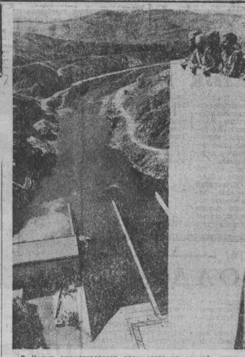
В Индии осуществляется план создания единой ирригационной системы в засушливых районах. В штате Химачал-Прадеш завершается строительство крупного гидромеханического предприятия, канал которого составляет 40 километров. Новый гидромеханический комплекс имеет большое экономическое значение для всей страны. Он позволит бросить более полумиллиона гектаров засушливых земель в ряды штатов страны и поддерживать постоянный уровень воды у платины электростанции Бхакра-Мангал, построенной с помощью Советского Союза. НА СНИМКЕ: на плотине электростанции Бхакра-Мангал.

тия, тратили намного больше средств на рекламу, чем на оборудование. Сотня больных, поверивших в живую рекламу, вносили в кассу залог за обещанную им помощь. Стремление заработать на здоровье людей быстро обернулось трагедией. Прибывший по одному из вызовов представитель центра не имел даже медицинского образования и длительное время находился в дежурном врате на ближайшей клинике, оказался роковым для больного. Сейчас против руководства центра возбуждено уголовное дело. Французская прогрессивная печать указывает, что возникновение подобных учреждений объясняется недостатком средств, выделяемых на нужды здравоохранения. В. ПАПШОВ.