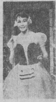
помню своим ученикам.

Любители балета могут считать, что вышедшим летом им повезло: они получили возможность познакомиться с творчеством крупной советской балерины — солистки Бурятского театра оперы и балета, народной артистки СССР Ларисы Сахьяновой. Сахьянова много работала в гастрольном репертуаре, танцевала разноплановые партии. Каждая встреча с ней оставляет чувство радости и восхищения у тех, кто пришел на спектакль. Актриса всегда танцует с полной отдачей, наполняя создаваемые ею образы поэзией чувств, большим духовным содержанием.