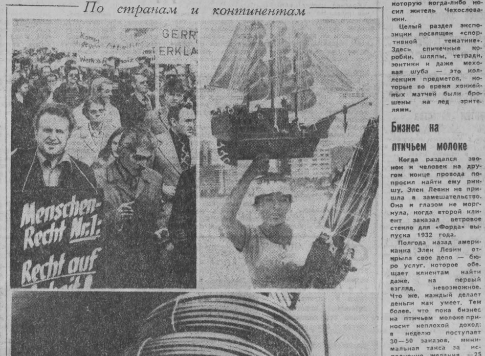
«Право человека № 1 — право на труд!» — гласит лозунг демонстрантов труженников предприятия концерна «Маннесман», борющихся за сохранение своих рабочих мест.

Бывший премьер-министр С. Бандаранаик обратился к населению с призывом прекратить враждовать, вызванную прошедшими выборами, и восстановить мир и порядок. Она пожелала успеха новому правительству и заявила, что принимает вердикт большинства избирателей.