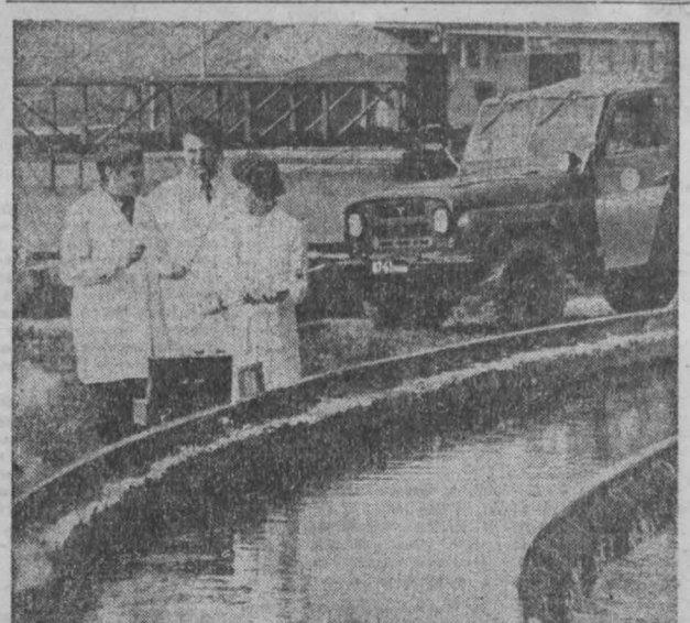
В Кишиневе — большом промышленном центре с десятками крупнейших заводов и фабрик — успешно решается проблема сохранения чистоты окружающей среды.