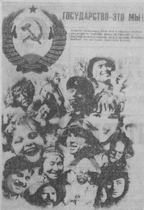
Плакат художников Е. Абезгус и С. Раева. Издательство «Плакат».

Презиум Верховного Совета СССР определяется как постоянно действующий орган Верховного Совета, подотчетный ему во всей своей деятельности. Высесей некоторые уточнения в компетенцию Президиума.