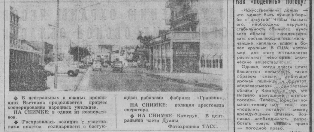
НА СНИМКЕ: Камерун. В центральной части Дуали.