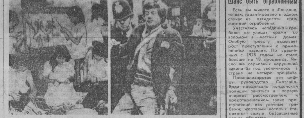
В центральные и южные провинции Вьетнама продолжается процесс кооперирования народных умельцев. НА СНИМКЕ: в одном из кооперативов. Распространяется полиция с участниками пикетов солидарности с бастующими рабочими фабрики «Гранвик».