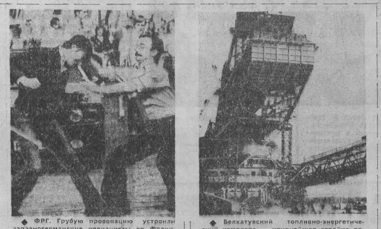
Белхатувский топливно-энергетический комплекс — крупнейшая стройка пятилетия в народной Польше. Этот мощный экскаватор (на снимке) будет работать на открытой добыче угля.