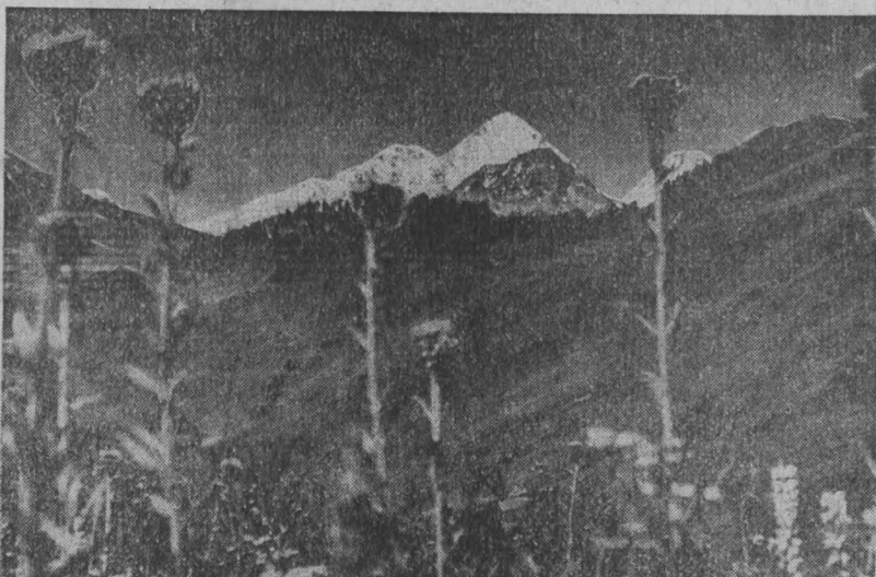
● БЕЛКИ ЛЕТОМ. г. Новокузнецк.

1 июля восход солнца в 4 часа 38 минут, заход в 22 часа. Длота дня 17 часов 22 минуты.