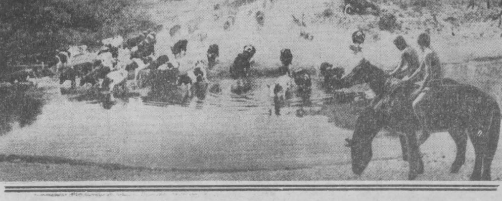
Работников пост «Кузбасса» р. п. Яшкино.

жение инертными материалами осталось на прежнем уровне. В мае по этой причине были большие простои, в июне строители тоже постоянно сидят на голодном пайке. Бетон требуется не только на главный корпус и на котельную. Специализированное управление № 5 начало работы на дороге, которая соединит железнодорожный путь с поселком. Здесь работает грейдер, подвозит щебень, часто бетонирование. Для нормальной работы дорожникам в сутки требуется по 60—70 кубов бетона. Пока они получают его в 3—5 раз меньше, а благоприятное время для работы уходит. Таким образом, на стройке сегодня проблема номер