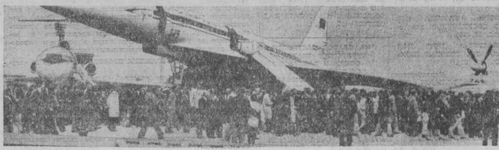
ПРИЖИЖ. Традиционный международный салон авиации и космонавтики открылся на территории парижского аэропорта Бурже. В павильонах и на открытых площадках свою продукцию демонстрируют 627 фирм и предприятий Франции, Чехословакии, Англии, Советского Союза, США, Польши, ГДР и других стран. НА СНИМКЕ: сверхзвуковой пассажирский самолет Ту-144 в аэропорту Бурже.

ПРАГА. Три четверти площади, отведенной в нынешнем году в ЧССР под озимую пшеницу, засеяно советскими сортами. Единые сельскохозяйственные кооперативы (ЕСХК) и государственные хозяйства собирают на этих площадях с каждым годом все большие урожаи. В честь 60-летия Великого Октября ЕСХК имени Чехословацко-советской дружбы в Турохаве близ Колина взяли обязательство собрать на площади 536 га в среднем по 51 центнера пшеницы советских сортов и выжать на соревновании не все сельскохозяйственные предприятия, несущие это имя. Почти половина коллектива нашей широкой отянки в стране.