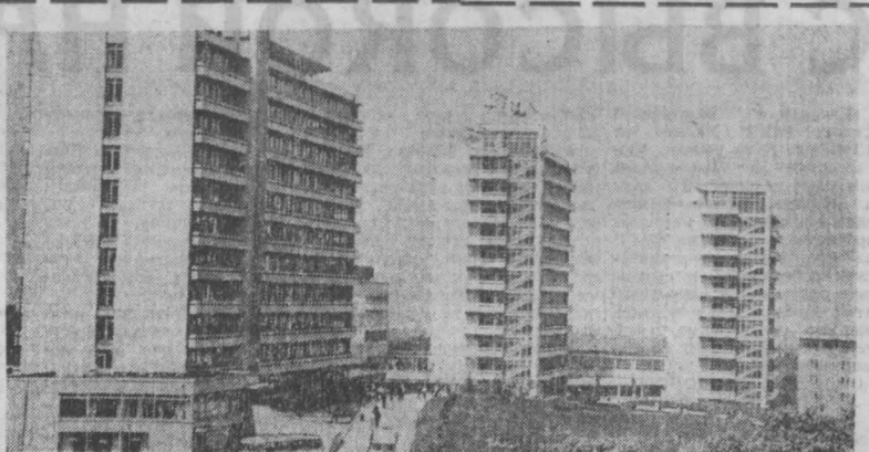
Львовская область. Город Трускавец — один из крупнейших бальнеологических курортов страны. За последние три десятилетия число мест в его санаториях возросло более чем в семь раз.

Состоялось торжественное открытие конкурса. В зале собрались видные мастера мировой хореографии, деятели культуры, представители общественности.