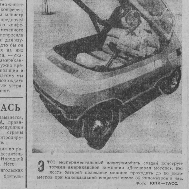
ЭТОТ экспериментальный автомобиль создан конструкторами американской компании «Дженерал моторс». Его аккумулятор позволяет машине проехать до 80 километров при максимальной скорости около 85 километров в час.