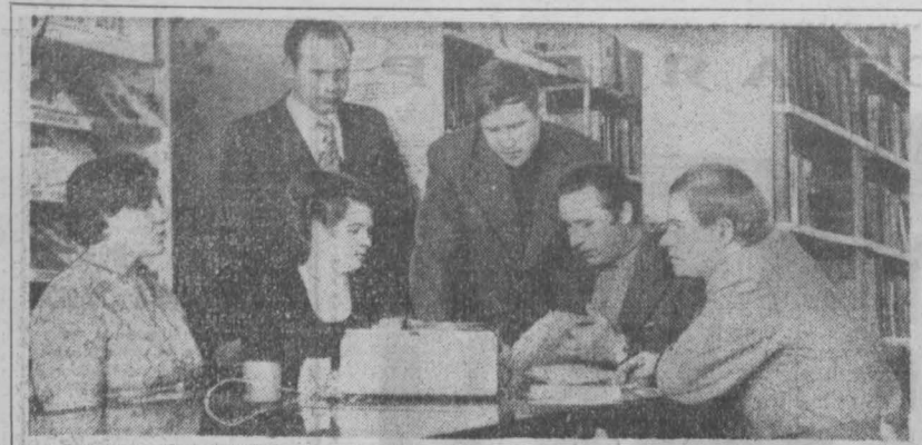
В совхозе «Сосновский» регулярно выходит эфир радиогазета «Сосновский вестник»...