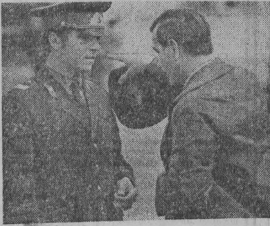
Идет смотр безопасности движения ФОТОРЕПОРТАЖ