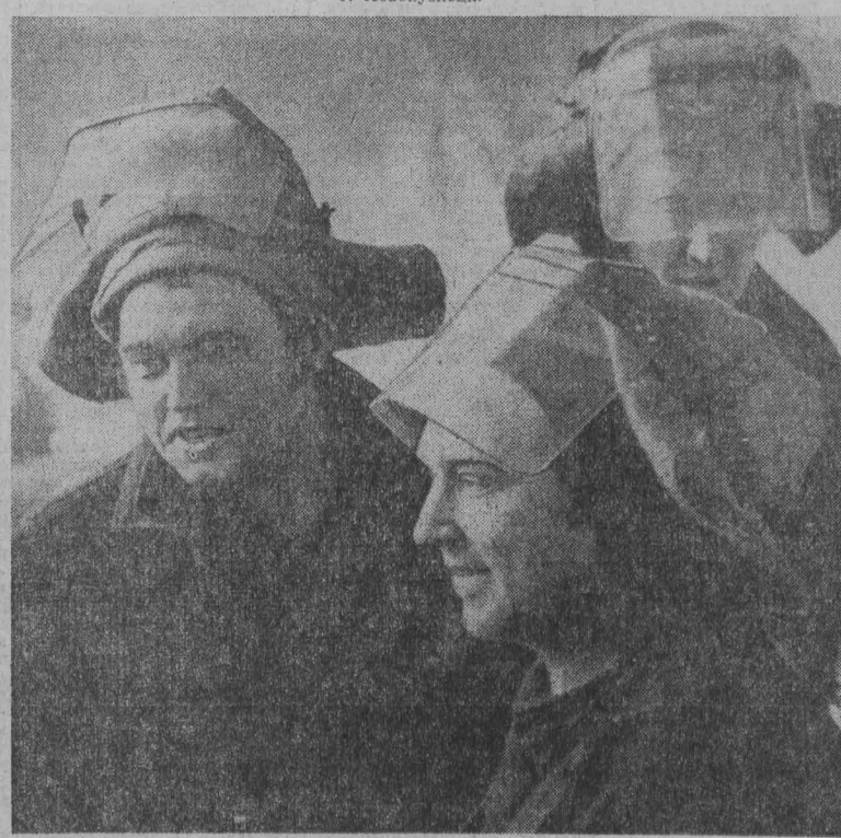
Знакомьтесь: обладатели кубка

С. БАРАНОВ, корр. газеты «Ленинский шахтер», г. Ленинск-Кузнецкий.