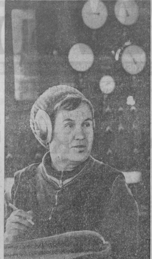
ВЫГОДНО, экономично сжигать под землей угольные пласты, чтобы получать отсюда газ для нужд промышленных предприятий...