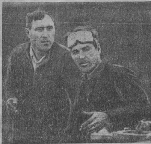
Участники совещания статистиков.

ЦЕНТРАЛЬНЫЙ КОМИТЕТ КПСС СОВЕТ МИНИСТРОВ СССР