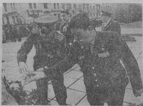
● НА КОНКУРС