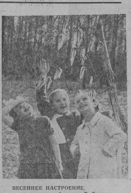
ВЕСЕННЕЕ НАСТРОЕНИЕ.

Лотерея есть лотерея. Не каждому судьба улыбнется. Но ныне она особенно щедро к кубассовцам. Прошло четыре месяца, а обладатели счастливых билетов получили 23 автомобиля; по пять — новозуаче, четыре — жители Ленинска-Кузнецкого. Есть также выигрыши в Междуречье, Тисульском районе.