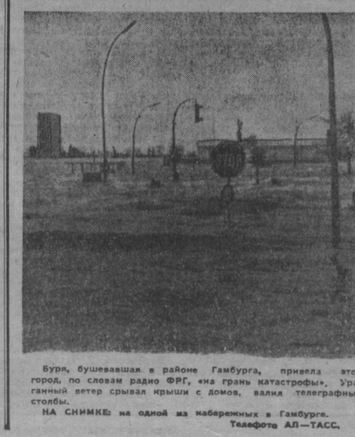
Буря, бушевавшая в районе Гамбурга, привела этот город по словам радио ФРГ, на грань катастрофы. Ураганный ветер срывал крыши с домов, валил телеграфные столбы.

КАРАКАС. Темпы роста валового национального продукта в странах Латинской Америки 1975 году снизились наполовину по сравнению с 1974 годом. Дефицит внешнеторгового баланса латиноамериканских стран (исключая страны — экспортеры нефти) превысил 10 млрд. долларов. Его сумма на 1 млрд. долларов больше, чем в 1974 году. Об этом сообщается в докладе об эконо-