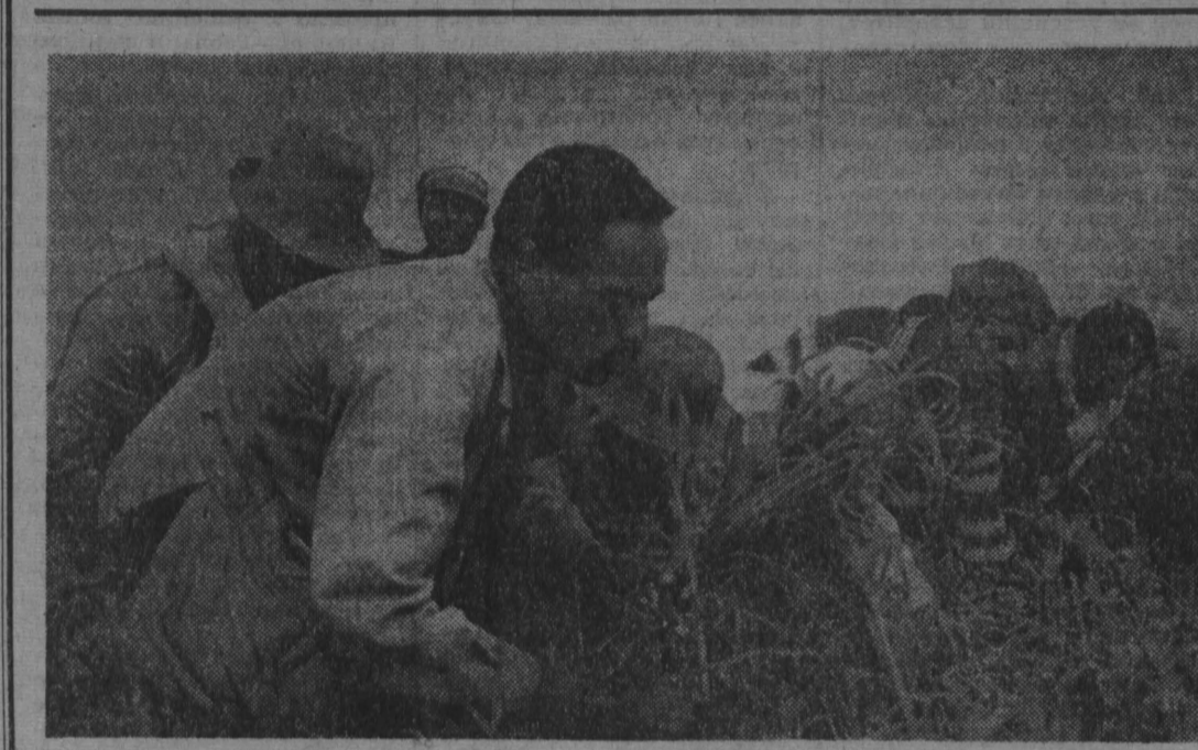
Правительство Эфиопии отводит земельные участки под строительство фермерских хозяйств в районах поднимания сельского хозяйства. В стране уже действует 16 тысяч таких ассоциаций, объединяющих более трех миллионов человек. Власти оказывают поддержку обединениям крестьян, предоставляя им семена, удобрения, техническую и финансовую помощь.

вив без крова десятки тысяч мирных жителей. И. Шахах привел на пресс-конференции один из известных ему примеров произвола оккупантов. После ареста жильца одного из домов по стандартному подозрению «в связях с палестинскими организациями» все остальные 92 человека, включая детей, стариков и больных, жившие в доме, были выброшены на улицу, а само здание полностью разрушено.