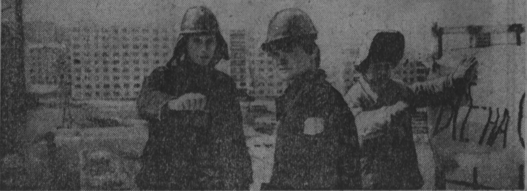
Отлично потрудились учащиеся Кемеровского пищевого техникума на благоустройстве улицы им. В. Терешковой. На снимке справа учащиеся техникума на субботнике.