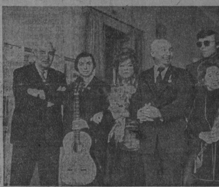
Союз кинематографистов СССР совместно с Аэрофлотом организовал специальный авиарейс в Сибирь. Большая группа артистов, режиссеров, сценаристов, отрядилась в сибирские города, чтобы встретиться там со зрителями, рассказать о последних работах крупнейших киностудий страны.

МОСКВА, 19 марта (Корр. ТАСС). Сессия общего собрания Академии наук СССР завершила работу. С докладом о деятельности