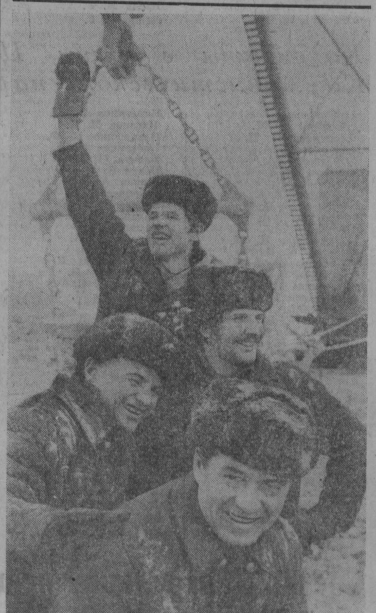
РАЗРЕЗ «Черниковский» — одно из передовых предприятий в производственном объединении «Кемеровуголь».

Новый прилавок творческого энтузиазма и открытий вызывает материалы XXV съезда КПСС. На рабочих собраниях цехов и участков горняки обсуждают материалы съезда, определяют свои задачи, берут повышенные обязательства. С первых дней нового года они успешно несут трудовую вахту.