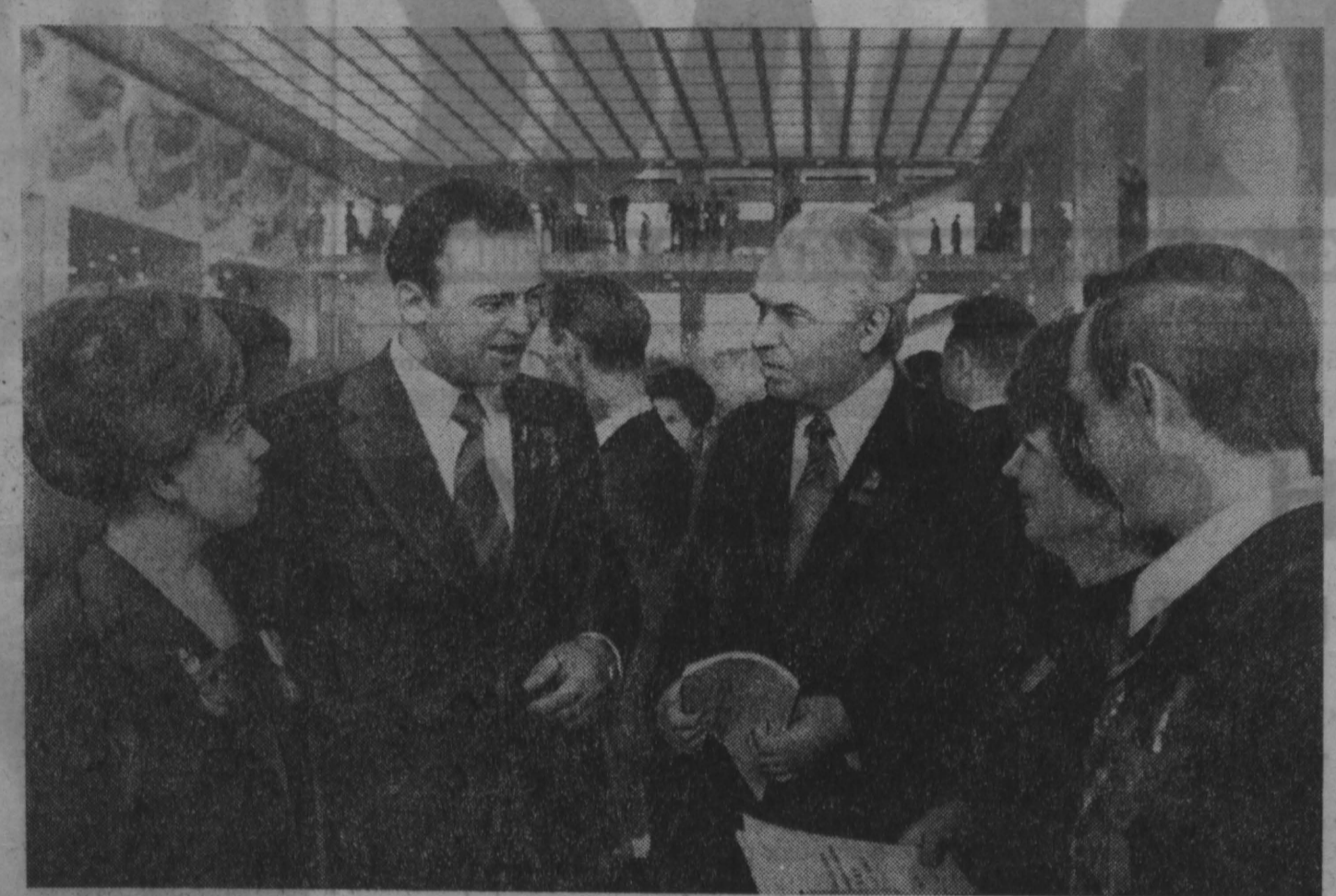
XXV съезд КПСС, Кремлевский Дворец съездов. НА СНИМКЕ: группа делегатов от Кемеровской областной партийной организации в перерыве между заседаниями.