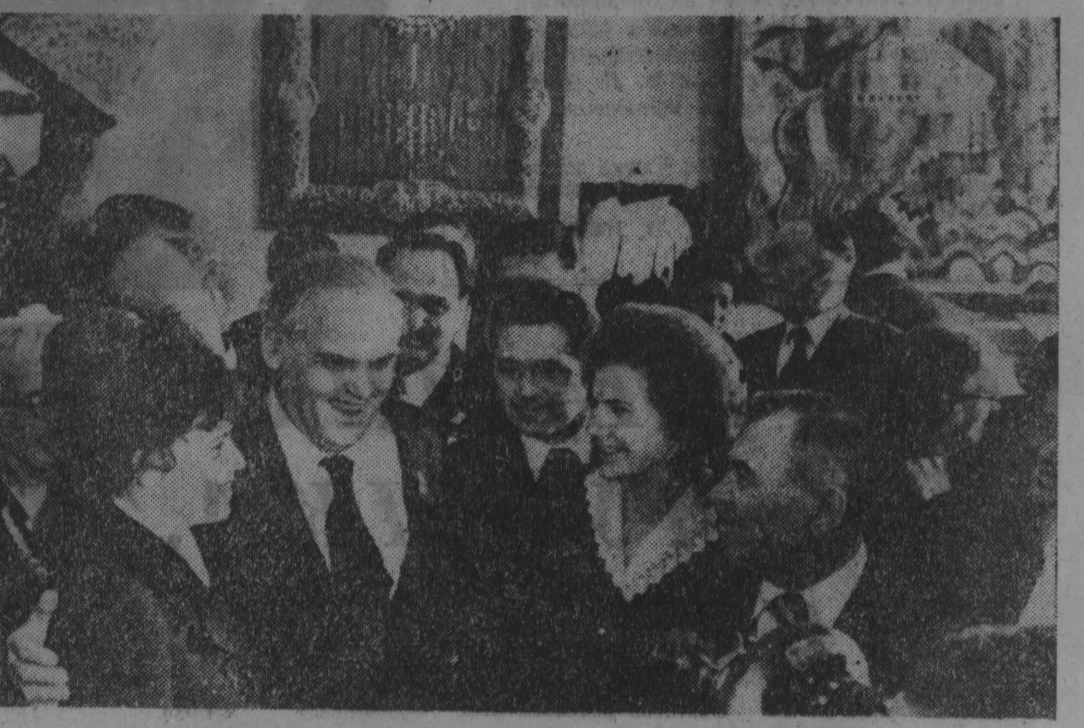
МОСКВА, Кремлевский Дворец съездов. XXV съезд КПСС. НА СНИМКЕ: Генеральный секретарь Коммунистической партии США Гас Холл среди делегатов съезда. Фотохроника ТАСС.

Венецианская «Неспешная» отмечает, что десятилетний план развития советского хозяйства — это план мирного коммунистического созидатель-