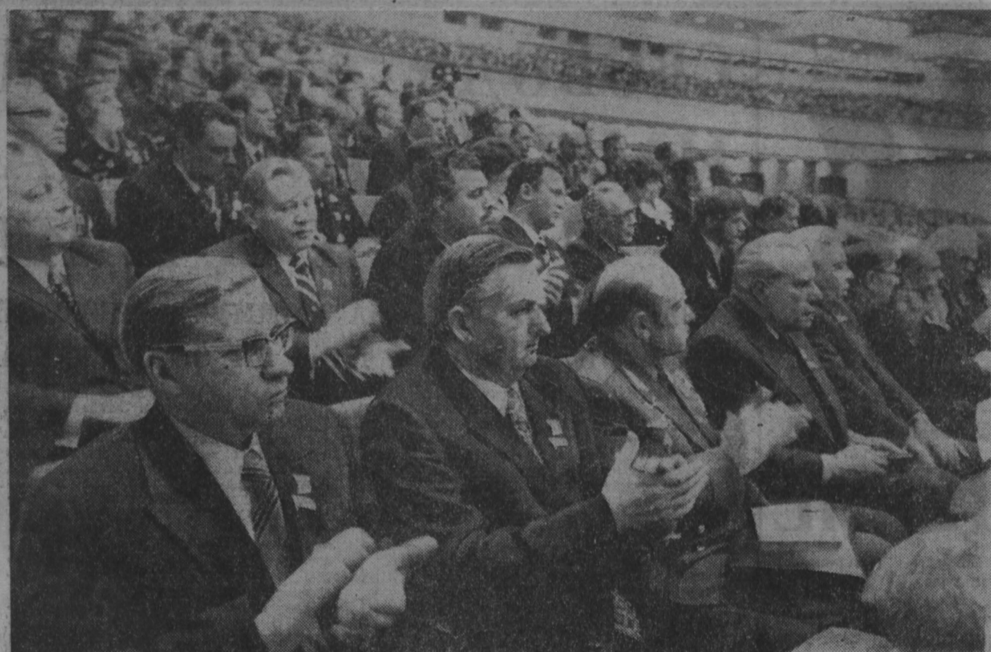
Делегация Кемеровской областной партийной организации в зале заседаний Кремлевского Дворца съездов.

1 марта в 10 часов утра в Кремлевском Дворце съездов продолжил работу XXV съезд Коммунистической партии Советского Союза.