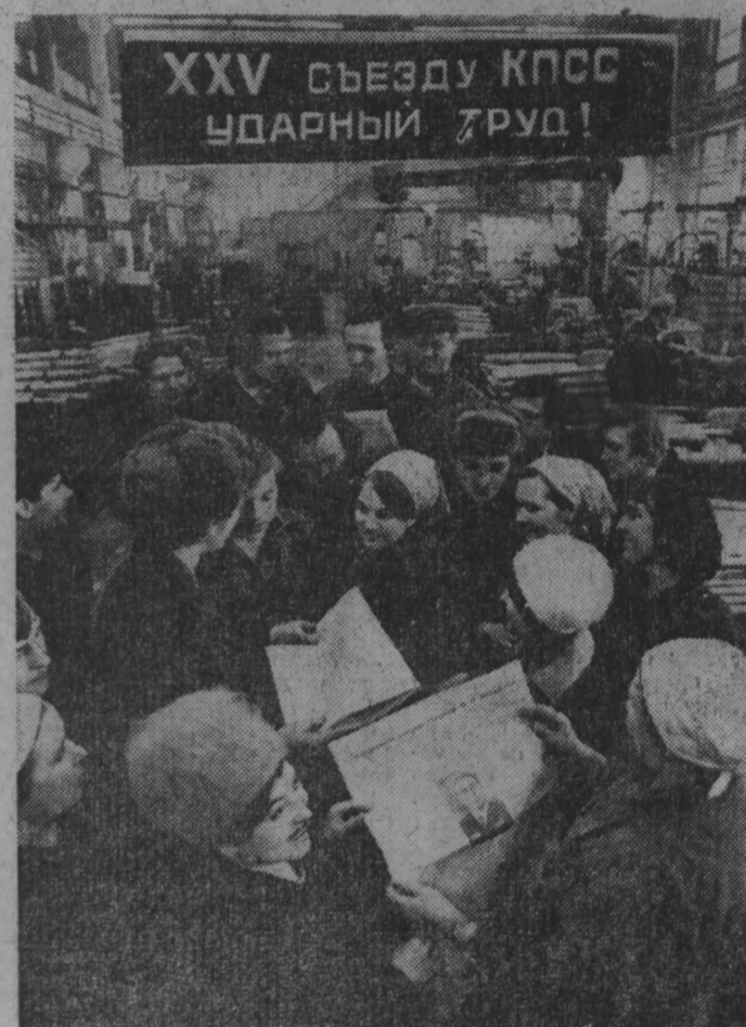
XXV съезду КПСС ударный труд!

Кипра, Мануэль Мора — Генеральный секретарь Центрального Комитета Партии народных авангард Коста-Рики, Никола Шаун — Генеральный секретарь Центрального Комитета Ливанской коммунистической партии и другие.