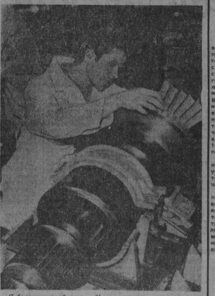
Самыми трудными подвоям начали новый год, а с ним — и новую пятилетку трудящиеся Польши. Открыт счет сверхплановой продукции — ее уже выпущено на миллионы злотых.