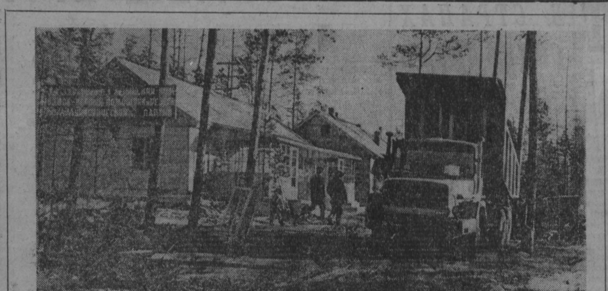
Б УРЯТСКАЯ АССР. На берегу Байкала на мысе Курлы началось строительство города Северобайкальска. Новый город станет одним из важнейших опорных пунктов строящейся Байкало-Анурской магистрали. В нем будут жить около 40 тысяч человек. Специальists ленинградского института «Гипрогор», проектировавшие Северобайкальск, позаботились о максимальных удобствах для жителей.