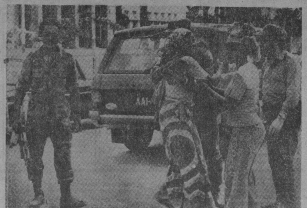
АНГОЛА. Продолжается наступление Национальной армии НРА. НА СНИМКЕ: жители освобожденных районов тепло встречают бойцов Национальной армии.

Банкнота с таким авторством попала в руки одного состоятельного «филантропа». От щедрот своих он опубликовал в газете фотографию ассигнации, сопроводив ее текстом: «Если и узнаю имя того, кто сделал процальную надпись на углу этой банкноты, в 100 песет, обещаю вернуть бывшему владельцу его прежние богатства».