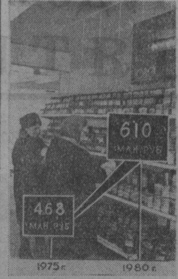
Рост товарооборота к 1980 году по сравнению с 1975 годом составит, как видите, более 30 процентов, или, иными словами, он увеличится на 142 миллиона рублей.

Начнет действовать вторая очередь производственного объекта «Азот». Будет закончено строительство второго коммунального моста через р. Томь и мостового перехода через р. Искитимку по Советскому проспекту. Предусмотрено также реконструкция (с расширением проезжей части) ныне действующего коммунального моста через реку Томь и моста через р. Искитимку по проспекту Ленина.