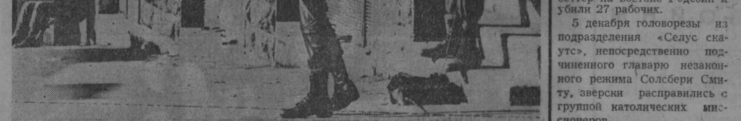
НА ЗАПАДНОМ БЕРЕГУ РЕКИ ИОРДАН ПРОШЛА ОДНОДНЕВНАЯ КАМПАНИЯ НЕПОВИНОЕНИЯ; ВЛАДЕЛЬЦЫ АРАБСКИХ МАГАЗИНОВ ОПУБЛИКОВАНЫМ ВЛАСТЯМИ ДОПОЛНИТЕЛЬНЫМ НАЛОГОМ, ПРИНЯТЫМ В ИЕРУСАЛЕ, ЗАКРЫЛИ МАГАЗИНЫ И ЛАВКИ В НАБЛУСЕ, РАМАЛЛАХЕ, ВИНДИКЕ И ДРУГИХ ГОРОДАХ. НА СНИМКЕ: ИЗРАИЛЬСКИЕ СОЛДАТЫ В НАБЛУСЕ.

5 декабря головорезы из подразделения «Селус снаутс», непосредственно подчиненного главарю незаконного режима Солсбери Смуту, зверски расправились с группой католических миссионеров.