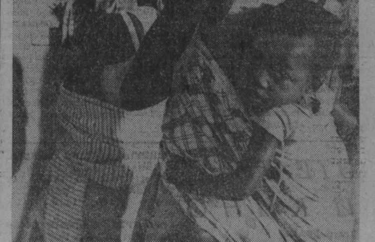
Большой популярностью у жителей Луанды и других городов Народной Республики Ангола пользуется советская фотовыставка «СССР — страна и люди». Многочисленные экспонаты знакомят посетителей с жизнью и достижениями Страны Советов. В последние дни выставку посетили свыше 35 тысяч человек.

Недавно, экспозиция была передана в дар ангольскому народу.