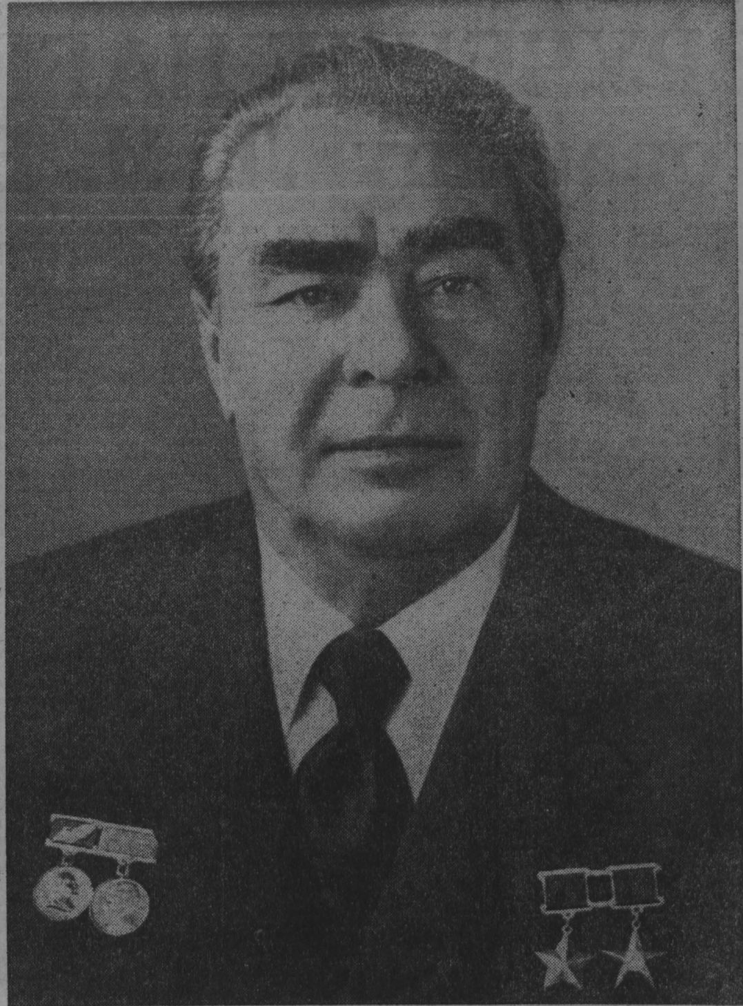
Генеральный секретарь ЦК КПСС товарищ Леонид Ильич Брежнев.

Выражая эти чувства и горячо поздравляя Вас, дорогой Леонид Ильич, с днем Вашего семидесятилетия, сердечно желаем Вам долгого здоровья и счастья, новых успехов в Вашей неустанной и плодотворной деятельности на благо советского народа, всех трудящихся, во имя торжества светлых идей мира и коммунизма.