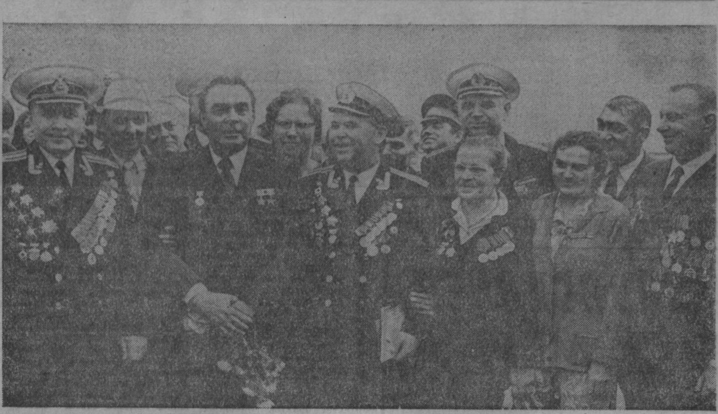
СЕНТЯБРЬ 1974 ГОДА. Преподнесение Генеральным секретарем ЦК КПСС Л. И. Брежневым в городе-герое Новосибирске. НА СНИМКЕ: Л. И. Брежнев с ветеранами войны.