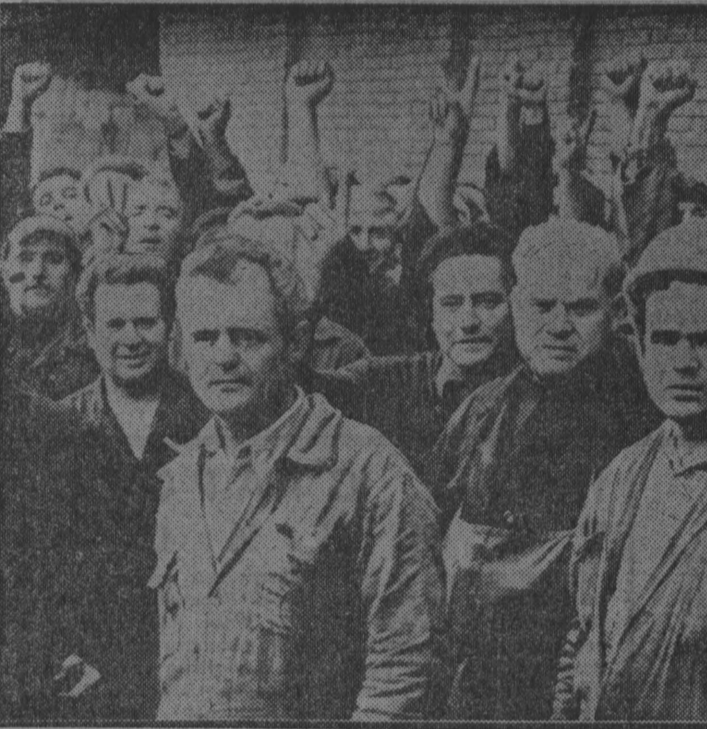
МАДРИД. Трудовой народ Испании выступает против экономической политики правительства, приводящей к ухудшению положения широких народных масс, в частности, против замораживания заработной платы и предоставления предпринимателям более широких прав при увольнении рабочих.

— дар американскому экипажу от Гruzинской академии художеств.