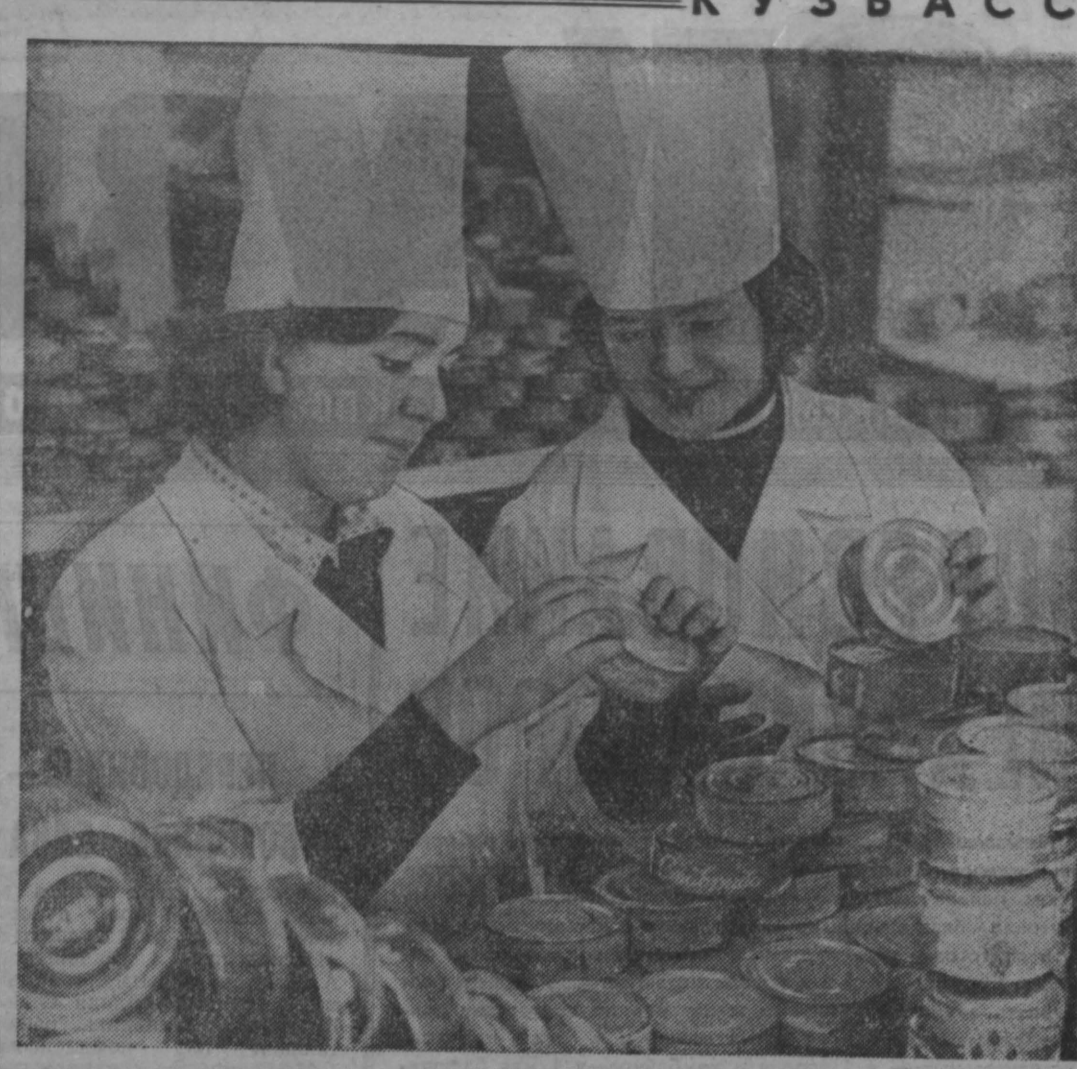
Магазин № 22, что расположен по улице Кузбасса в поселке Яшкino, самый большой в районе. Сотрудники магазина делают все, чтобы покупатель меньше тратил времени. Здесь всегда большой выбор фасованных продуктов.

Дли этого, кроме административных мер, необходимо укрепить базу, прежде всего ускорить строительство завода по производству железобетонных изделий и плит в Белове и назвать в ближайшее время строительство завода по ремонту подвижного состава и путевой техники.