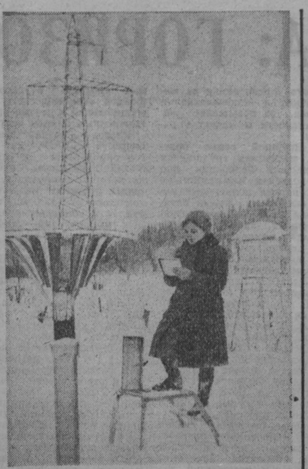
Температура и влажность воздуха, атмосферное давление, скорость ветра, количество выпавших осадков и многие другие сведения регулярно передают метеорологическая станция, расположенная в поселке Лужба.