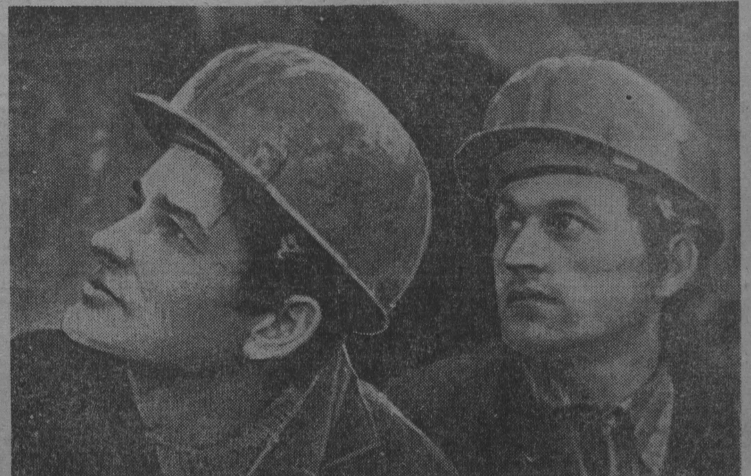
Один из молодых в Кузбассе угольный разрез «Черный» объединений «Кем. уголь» недавно пополнил...