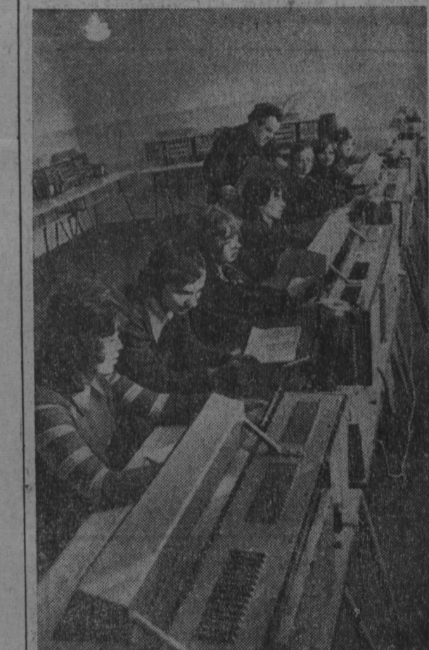
НА СНИМКЕ: идут занятия в лаборатории электротехники. г. Белово.