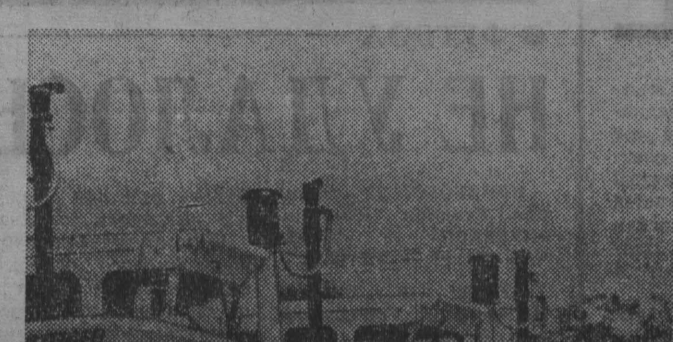
ВЕНГРИЯ. Благодаря кооперации с советскими заводами на машиностроительном предприятии «Раба» создано крупное производство унифицированных узлов. Это позволило венгерскому заводу значительно увеличить выпуск продукции, расширить ее ассортимент.

Особенно важная роль в мировой системе социализма принадлежит странам — членам СЭВ.