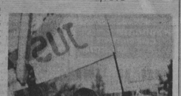
НА СНИМКЕ: на демонстрации.

● Все более широким размахом приобретает борьба трудящихся плавания за улучшение своего материального положения. 12 сентября сотни жителей Мадрида вышли на улицы города, чтобы выразить протест против растущей стоимости жизни.