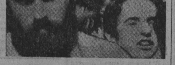
НА СНИМКЕ: оккупанты.

● Население Западного берега реки Иордан не желает мириться с незаконным оккупационным режимом и ведет борьбу за его ликвидацию. Вооруженная во главе с местными властями группа направляется с местным населением.