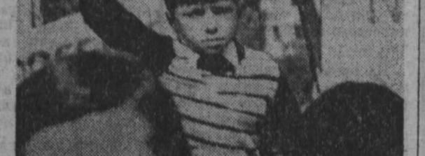
НА СНИМКЕ: на демонстрации.

● Власти Тель-Авива не оставляют надежд на вынесение приговора захваченным в плен на Голанских высотах и Западном берегу реки Иордан военнопленным.